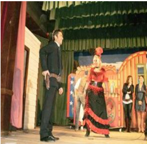
El Presidente se bate en duelo en el espectáculo.

Durante el almuerzo, asistimos a un divertido espectáculo de variedades en el "Saloon" del Sioux City: lazada americana, duelos y humor