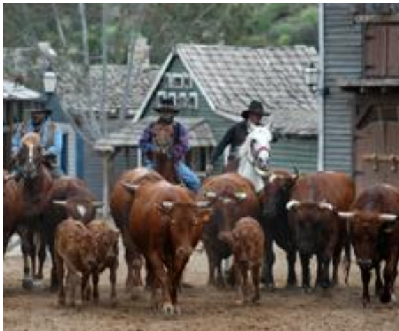
Los cowboys conducen el ganado por el Pueblo.