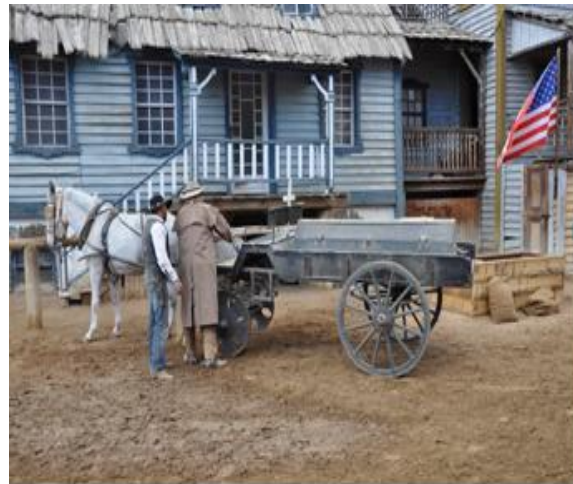
El presidente es recogido por los enterradores tras perder el duelo