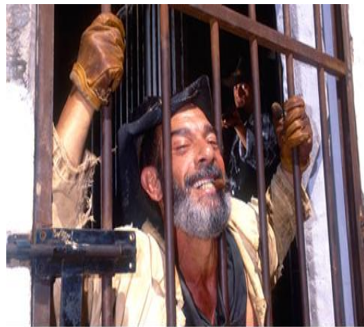
Un temible forajido es encarcelado tras el asalto fallido al banco