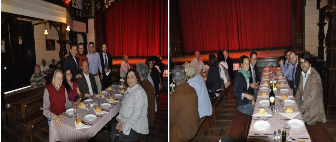
Varias fotos de familia del grupo antes de almorzar en las mesas preparadas en el Saloon